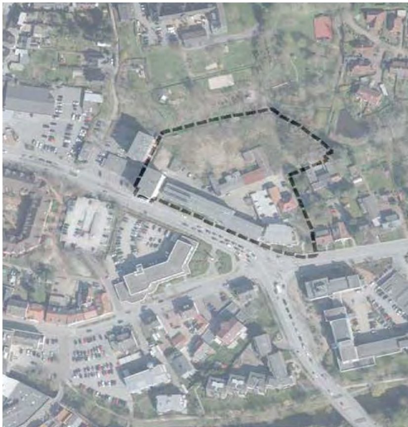
Luftbildausschnitt aus dem Liegenschaftskataster, ohne Maßstab, mit Umriss des Geltungsbereiches des B-Planes 101