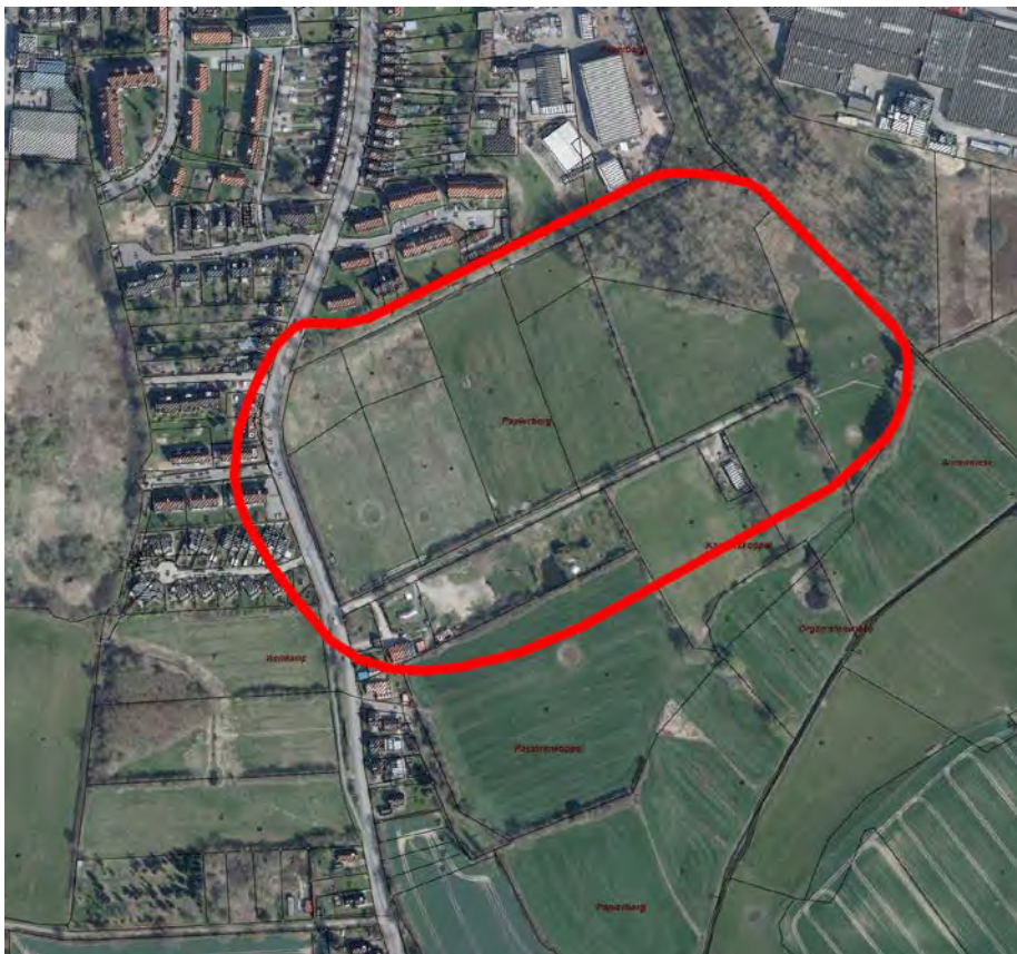
Luftbildausschnitt aus dem Liegenschaftskataster, ohne Maßstab, mit Umriss des Planbereiches