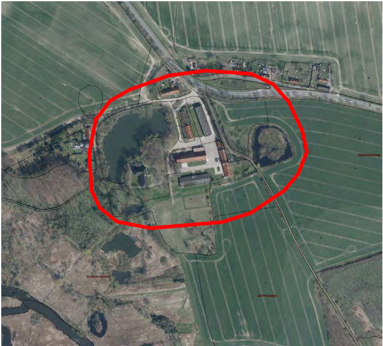
Luftbildausschnitt aus dem Liegenschaftskataster, ohne Maßstab, mit Umriss des Planbereiches